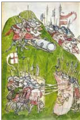
Obrázok 4: Husiti v boji proti križiakom

Roku 1419 zomrel český kráľ Václav IV. a Žigmund, ako jeho mladší brat, považoval uprázdnený trón za svoje dedičstvo. Česká kališnická šľachta ho však odmietla. Žigmund sa v rámci prvej križiackej výpravy proti husitom roku 1420 dal v Prahe korunovať za českého kráľa, no vládu v Čechách nezískal. Husiti porazili aj všetky ďalšie križiacke výpravy, ktoré dovedna päťkrát zaútočili na územie Českého kráľovstva.