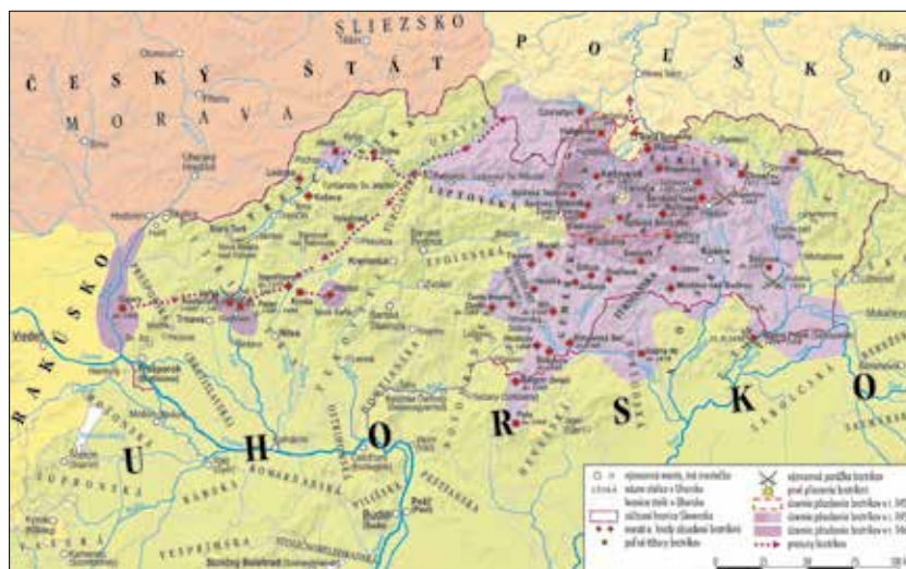
Obrázok 10: Pôsobenie bratříkov v Hornom Uhorsku v druhej polovici 15. storočia

Kráľ Matej Korvín, ktorý panoval v rokoch 1458 – 1490 sa hneď po nástupe na trón usiloval zúčtovať s Jánom Jiskrom z Brandýsa a bratříkami, ktorí sa opäť stali spojencami a šarapatili v hornouhorských stoliciach. Bola to vlastne stará podlžnosť, ktorú sa nepodarilo splatiť jeho otcovi Jánovi Huňadymu, ani Matejovmu staršiemu bratovi Ladislavovi. Hnutie bratříkov dosiahlo práve vtedy najväčší rozmach; ich počet sa zvýšil takmer na 20-tisíc mužov v 36 poľných táboroch, ale obsadených mali aj viacero hradov, pevností a pod ich kontrolou bolo nejedno mesto či mestečko na Slovensku.