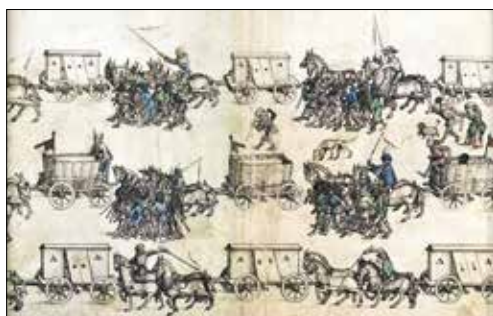
Obrázok 7: Žoldnieri s vozmi na pochode Kresba v súvekom rakúskom kódexe zvanom Hausbuch