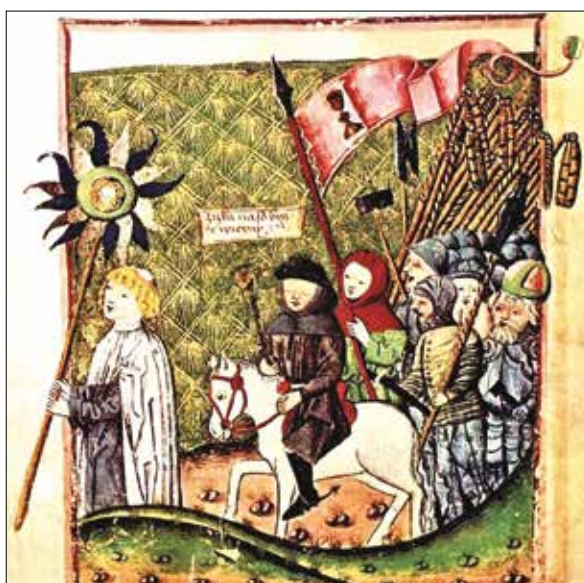
Obrázok 3: Slepý Jan Žižka na čele husitského vojska

Najdôležitejším husitským predpisom bol Vojenský poriadok Jana Žižku z Trocnova. Ide vlastne o zápis uznesenia členov Žižkovho bratstva, ktorí sa na jar v roku 1423 zišli na stretnutí v Nemeckom (dnes Havlíčkovom) Brode. Poriadok má dovedna 12 článkov zameraných na disciplínu.