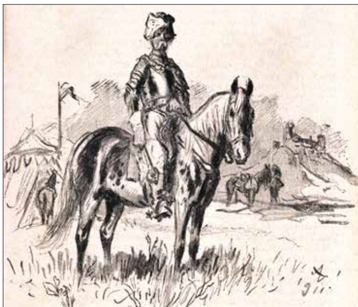
Obrázok 9: Bratřícky hajtman

Ďalšími významnými bratříckymi veliteľmi boli Matej z Kňažíc, ktorý sídlil na Šarišskom hrade, Ján Talafúz ovládajúci Richnavu, Peter z Radkova a po ňom Peter zo Snakova boli hajtmanmi Brezovického hradu, Jakub z Paňoviec, prezývaný Tele, bol hajtmanom v Podolínci a na Plavečskom hrade, neskôr hlavným hajtmanom bratříkov v Gemeri. Kapitánom Kežmarku bol pôvodne Mikuláš Brcál, keď sa roku 1449 stal spišským županom, funkciu prevzal jeho brat Martin Brcál, ktorý bol predtým začas kapitánom Rožňavy. Spolu s Martinom Brcálom hajtmanskú funkciu v Kežmarku vykonával aj Bartoš (Bartošek) z Hartvíkovic. K bratříkom sa na istý čas pridali aj veľmoži Mikuláš Pongrác zo (Svätého) Mikuláša, ktorý ovládal veľké územie západného a severného Slovenska. Jeho sídlom bol hrad Branč. Na Záhorí a vo východnom Rakúsku operoval Vaněk z Rachmanova, nazývaný Ledvinka i Mladvenko. Kronikár Ján z Turca a po ňom aj humanistický dejepisec Antonio Bonfini spomínajú zhodne aj ďalšie mená: Ribald, Kerský, Urik a Slovačko. (Ide inak o prvú zmienku etnonyma Slovákov v tlačenej, čiže inkunábulovej podobe.)