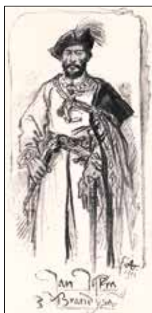
Obrázok 6: Ján Jiskra z Brandýsa Kresba od Mikoláša Aleša

Pre pochopenie genézy bratříkov je potrebné vrátiť sa do obdobia po smrti kráľa Albrechta (vládol v rokoch 1437 – 1439), keď sa v Uhorsku rozpútal zápas o uhorský trón. Od roku 1440 takmer celé stredné a východné Slovensko ovládal Ján Jiskra z Brandýsa, moravský či český žoldniersky kapitán v službách kráľovnej Alžbety, ktorého úlohou bolo zabezpečiť nástupnícke práva pre Alžbetinho maloletého syna Ladislava Pohrobka proti Vladislavovi I. Jagelovskému. Jiskra sa osvedčil už v službách Alžbetinho otca Žigmunda Luxemburského i manžela Albrechta. Bol typickým odchovancom husitského vojenstva aj napriek tomu, že sám ako katolík bojoval práve proti husitom.