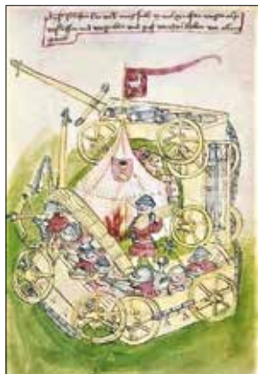
Obrázok 2: Husitská vozová hradba

Iluminácia vo Viedenskom kódexe z 1. polovice 15. storočia