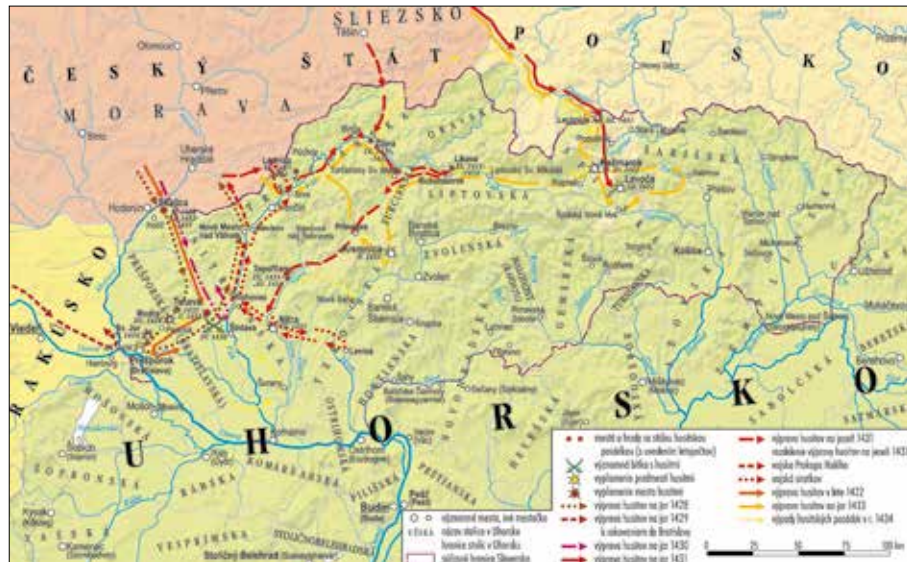
Obrázok 5: Vpády husitov do Uhorska v rokoch 1428 – 1435

táboritov Prokopa Holého, sirotkov na čele s Prokúpkom a Pražanov posilnených moravskými oddielmi Jána Tovačovského vysoko prevýšili nepripravené uhorské branné sily. Cez Považie sa posledné husitské oddiely v máji 1428 vrátili domov. Rokovania o zmierení, ktoré viedol kráľ Žigmund Luxemburský s husitským vodcom Prokopom Holým v Bratislave v dňoch 28. marca – 8. apríla 1429 skončili neúspešne a husiti sa následne pripravili na ďalší vpád do Uhorska.