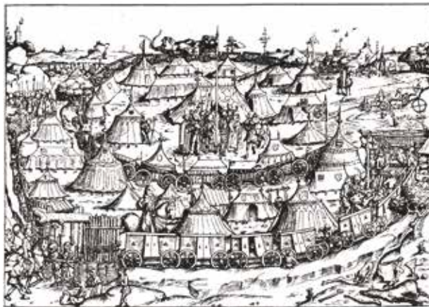
Obrázok 1: Tábor vozovej hradby

Najpreslávenejšou zložkou husitského poľného vojska bola bojová vozba, ktorá sa používala ako vozová hradba i ako prepravný prostriedok.